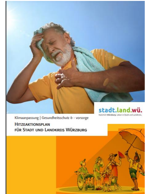
Heat action plan City and District of Würzburg 2023: https://www.wuerzburg.de/m_582456_dl