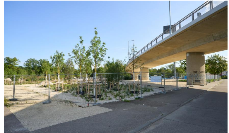
Bridge Park Ellwangen

Description: Spaces under large bridges are usually not well used. In Ellwangen, the space under a bridge is now used for green and public infrastructure (skate park, small football pitches). At the same time, the bridge provides shade, which is complemented by newly planted poplar groves. The park is used as a link between the city centre and residential areas.